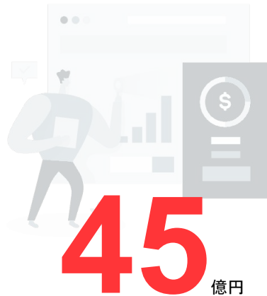
累積広告運用予算