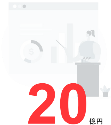
年間広告運用予算